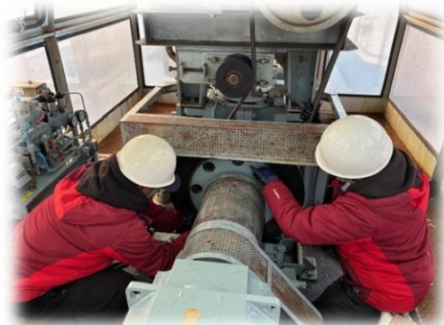
《予備原動機操作訓練》