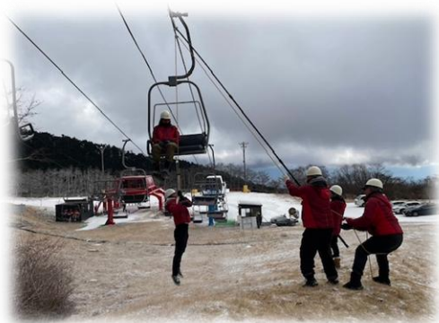
《脱索を想定した救助訓練》